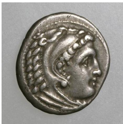
Монета (драхма) с изображением Александра Великого. Македония, 336 – 323 гг. до н.э. Государственный Эрмитаж

23 февраля 2023 года в Центре «Эрмитаж- Казань» открывается выставка «Александр Македонский. Путь на Восток». Государственный Эрмитаж представит в столице Татарстана масштабную эпопею, посвящённую самому великому царю и полководцу всех времён и народов. Около 400 экспонатов расскажут о Восточном походе Александра, о распространении греческой культуры на огромных территориях Азии и о величии классического искусства Эллады. Выставка станет центральным событием Дней Эрмитажа в Казани, которые пройдут с 21 по 23 февраля 2023 года.