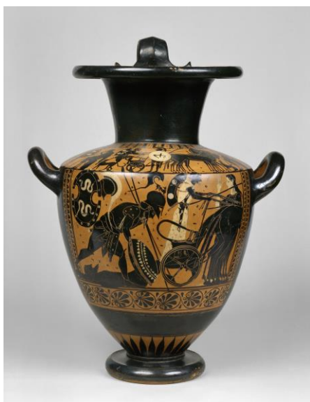
Гидрия чернофигурная Аттика, около 510 года до н.э. Группа Леагра, мастер Антиопы Государственный Эрмитаж

С деятельностью Александра Македонского принято связывать начало новой исторической эпохи. Восточный поход завоевателя – самый далекий в истории человечества военный поход – привел к разрушению Персидской империи, расширив границы греческой цивилизации. В эллинистическом искусстве черты Александра можно встретить повсюду – в портретах правителей, в статуях богов и героев и даже в декоративном искусстве. Образ великого царя, возникший в смешении традиций и культур, надолго пережил античную эпоху. В западноевропейских миниатюрах Александр изображался как странствующий рыцарь, в русском лубке XVII – XVIII веков – как авантюрный герой. В XIV – XV веках на Востоке Александр-Искандер – идеальный герой и грозный воин, в искусстве Возрождения – мудрый государь. Особенную актуальность «Истории Александра» приобрели в период абсолютных монархий при дворах правителей Франции, Англии, России.