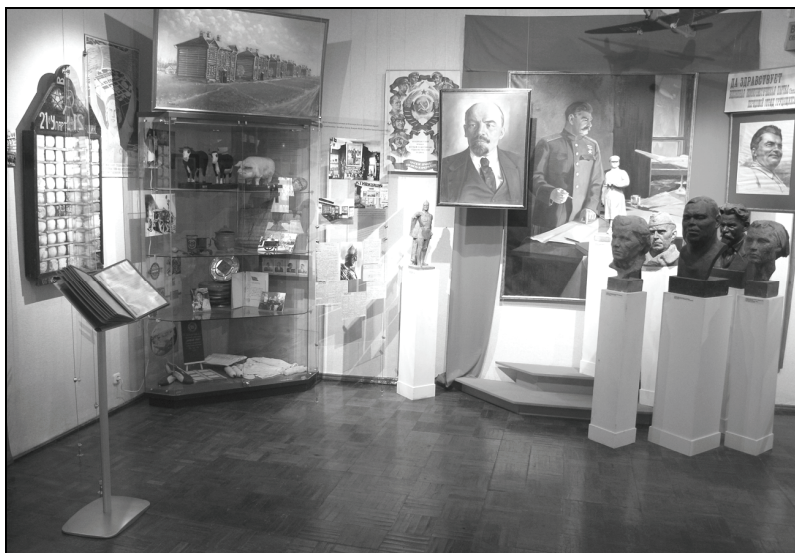
Фото 2. Выставка «Хранители вечности». Переславский музей-заповедник, 2009 г.