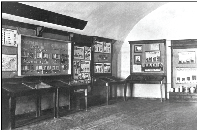
Фото 1. Экспозиция Переславского музея 1930-е гг.