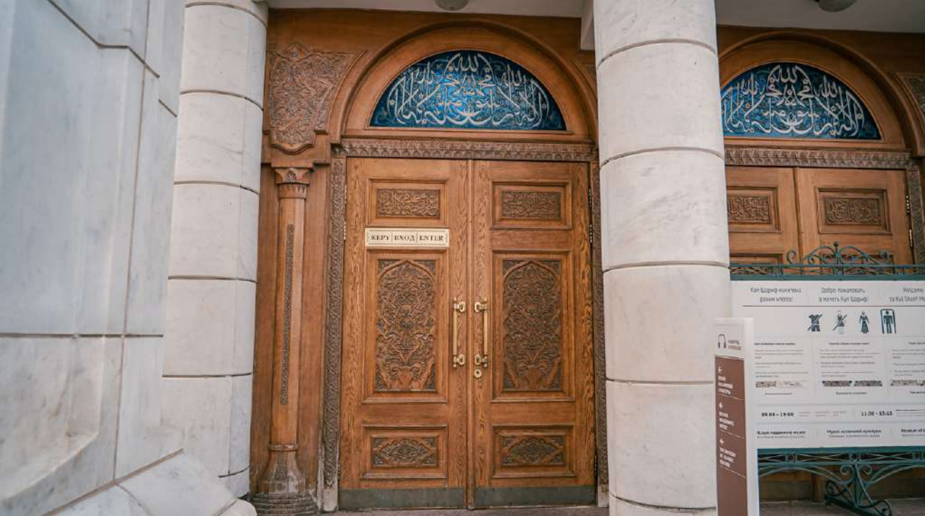
Вход в мечеть Кул Шариф выглядит так.