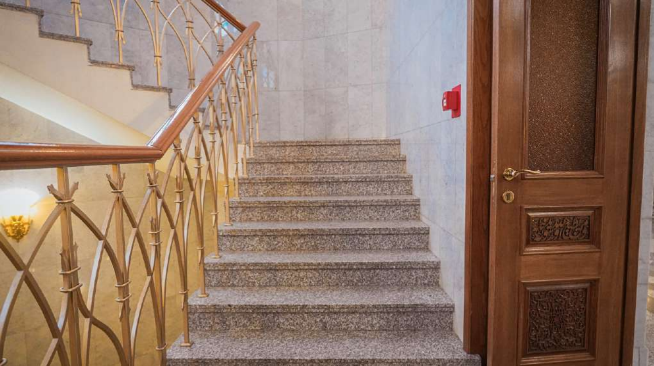
Лестница выглядит так.